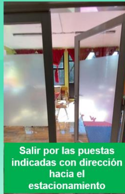
Salir por las puertas indicadas con dirección hacia el estacionamiento