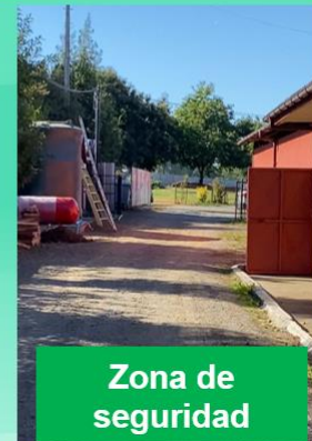
Zona de seguridad