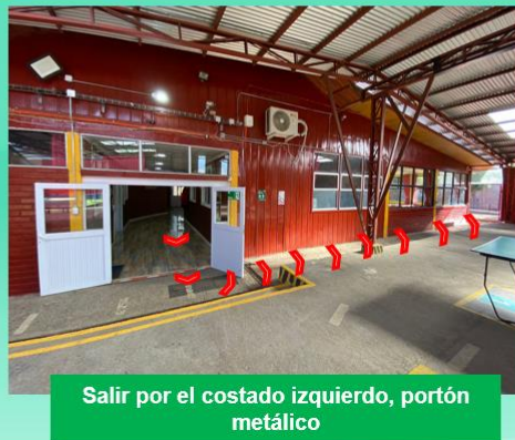
Salir por el costado izquierdo, portón metálico