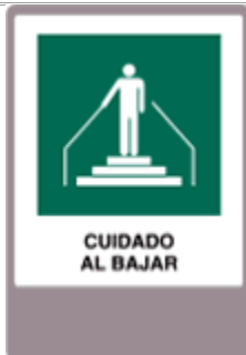
Cuidado al bajar.

Señal de carácter informativo, que indica la existencia de un desnivel, por tal razón en las zonas en que se advierta esta señal, se deberá tener cuidado al transitar. Instalación: En lugares visibles tales como: cajas escalera, desniveles de piso, etc. Esta señal se instalará tanto en edificios públicos y privados, siendo su instalación directamente en muros u otras estructuras.