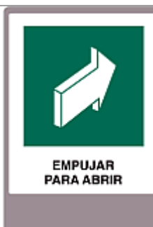
Empujar para abrir

Señal de precaución, en zonas en que se advierta este tipo de señal, se deberá tener especial cuidado con descargas eléctricas. Instalación: En lugares visibles tales como: tableros eléctricos, estaciones y subestaciones eléctricas, etc. Esta señal se instalará directamente en muros o tableros eléctricos.