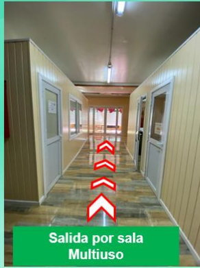
Salida por sala Multiuso