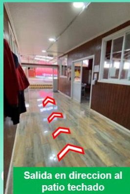
Salida en dirección al patio techado