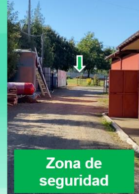
Zona de seguridad