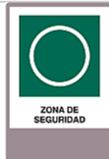
Zona de seguridad.

Señal de carácter informativo, que indica la existencia de un desnivel, por tal razón en las zonas en que se advierta esta señal, se deberá tener cuidado al transitar. Instalación: En lugares visibles tales como: cajas escalera, desniveles de piso, etc. Esta señal se instalará tanto en edificios públicos y privados, siendo su instalación directamente en muros u otras estructuras.